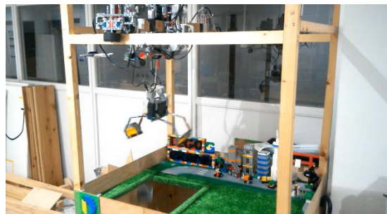
クレーンがつかんだものを放している様子