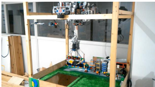
クレーンが物をつかんでいる様子