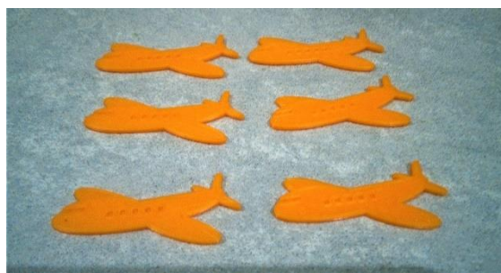
3D プリンターで作ったお客様に渡す景品